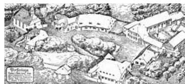
Raymund Brachmann: Entwurf eines idealen Dorfes für die Internationale Bauausstellung in Leipzig, 1913